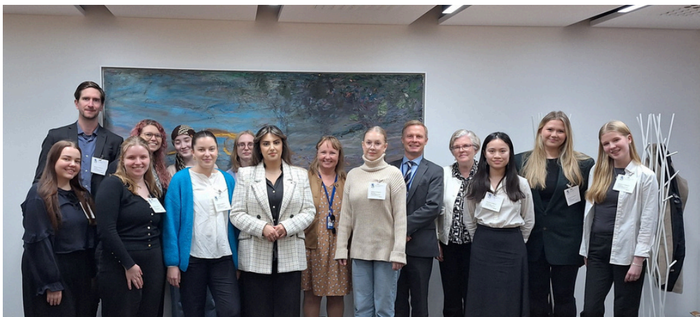
Syksyllä 2024 Generation Equality -nuortenryhmän tapaaminen ulkoministeriön kanssa.

“Julkisessa keskustelussa spekuloidaan usein sitä miksei teknologia-ala kiinnosta tyttöjä vaikka pitäisi keskittyä enemmän siihen miten tytöt, naiset ja vähemmistöt tuntisi olonsa tervetulleiksi teknologia-alalla. Olennaista olisi miettiä, miten naisille voitaisiin tarjota enemmän mahdollisuuksia osallistua teknologian kehittämiseen.” - Generation Equality -nuortenryhmän jäsen